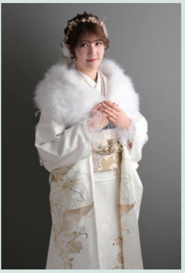
My Favorite Type Elegant