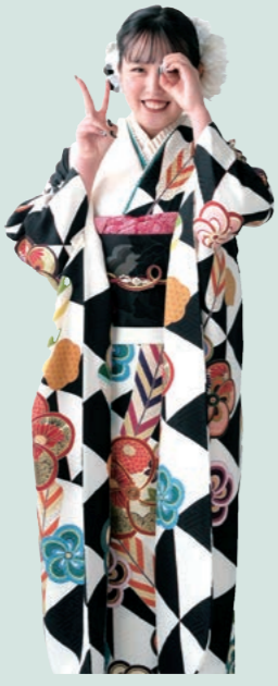
My Favorite Type Retro