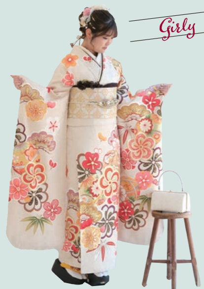
My Favorite Type Girly