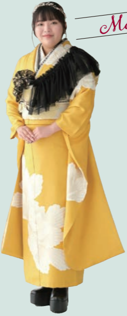
My Favorite Type Mode