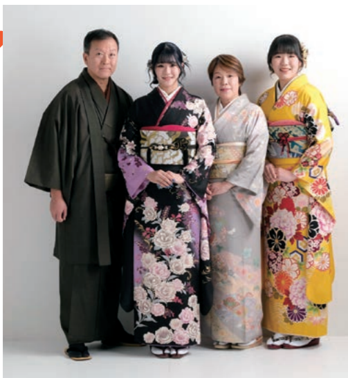
素敵な振袖姿を見せてくれてありがとう！