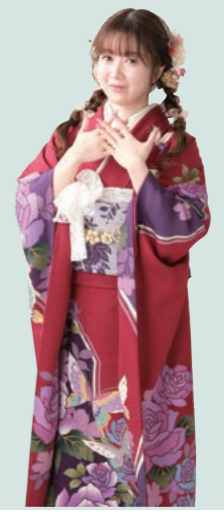
My Favorite Type Mamafuri