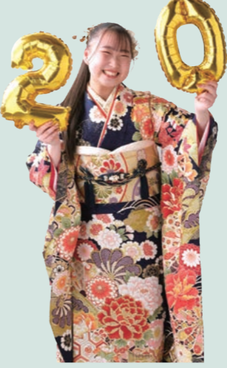
My Favorite Type Gorgeous