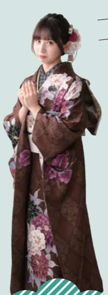
My Favorite Type Chic