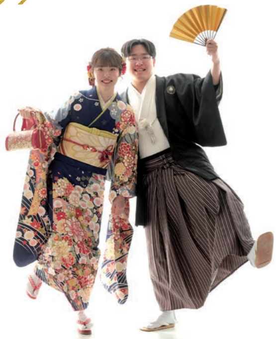
全員きもので家族写真、母が一番嬉しそうでした