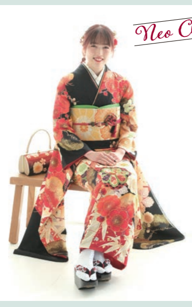
My Favorite Type Neo Classic