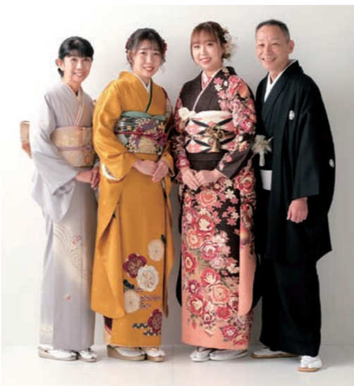
お嬢様からのメッセージ 大学生として一人暮らしをさせてもらい本当に感謝しています。父も母も姉も大好きです！！

華麗さ際立つ優月さん。「お店の方々のセンスが良く、提案して下さった振袖がイメージ通りで、親バカですが可愛かったですね。家族写真は娘の希望で漫画『ジョジョの奇妙な冒険』のキャラクターの立ちポーズで撮っていただき楽しかったです」とお母様。