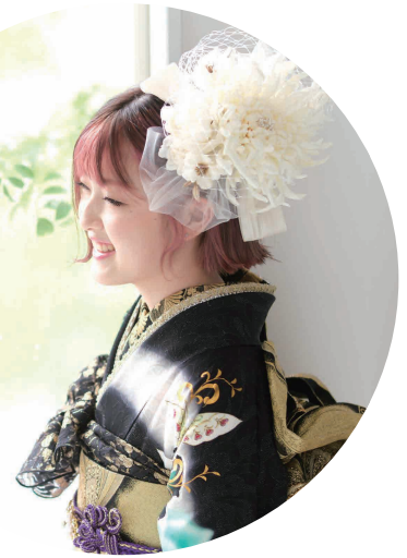
お嬢様へのメッセージ 成人おめでとう。自分の目標に向かって頑張ってくださいね。

「オシャレが大好きな娘で、振袖も小物もスタッフさんと相談しながら全て本人が決めました。振袖に合わせてカラーリングしたボブヘアや髪飾りがポイントです。お支度の全てを見させてもらい私も幸せな時間が過ごせました」とお母様です。