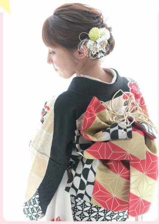
お嬢様からのメッセージ キレイな振袖を着させてくれてありがとう。