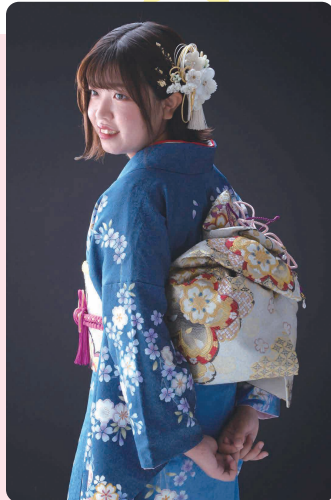
お嬢様へのメッセージ これから先、大変なこともあるかと思いますが、家族みんなで応援しているので頑張ってくださいね。

「娘のこだわりは『青系』で、柄は私好みで選んだ振袖です。自分のときは従姉妹に借りた振袖だったので、今回娘と一緒に選ぶことができ自分ごとのように嬉しかったです。ボブヘアを活かした髪型も素敵で、振袖姿はとてよく似合っていました」とお母様です。