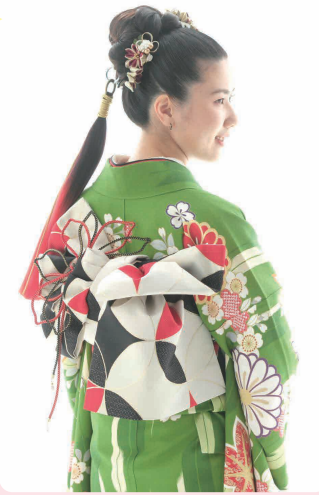
お嬢様からのメッセージ 今まで育ててくれてありがとう。生活面でいろいろお世話をしてもらい感謝しています。