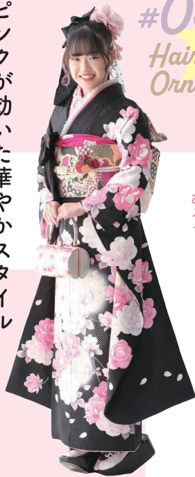
お嬢様へのメッセージ 成人おめでとう。これからも華やかに笑顔で過ごして行ってね。

「娘がひと目ぼれした振袖に、帯や小物も娘を選びました。髪型にもこだわり、黒髪にピンクのインナーカラーを入れ、髪飾りもトップにつけて華やかさを出したようです。娘らしい振袖姿でいいなと思いました」とお母様。お父様も「可愛いな〜」と喜ばれていたそうです。