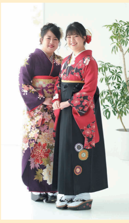
姉妹一緒に終始笑顔の撮影会

お嬢様へのメッセージ 今のままのひよりらしく、笑顔を絶やさずに素敵な女性になってください。