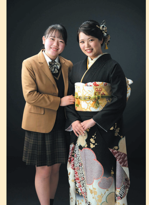
トータルコーディネートに大満足!