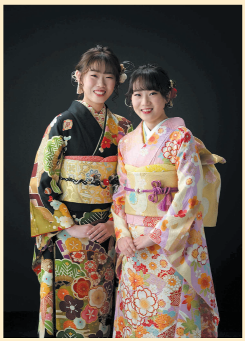
姉妹並んでお支度する姿も思い出に