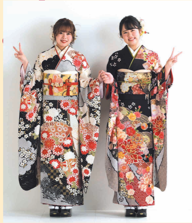
振袖姿で新しい自分を表現!