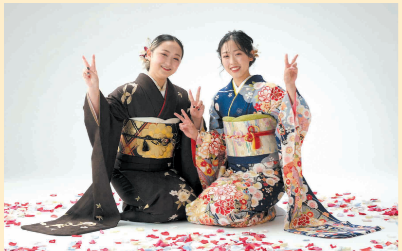
和気あいあいと楽しい撮影会に

お嬢様からのメッセージ 二十年間いろいろとしてくれてありがとう。ただただ感謝しかありません。