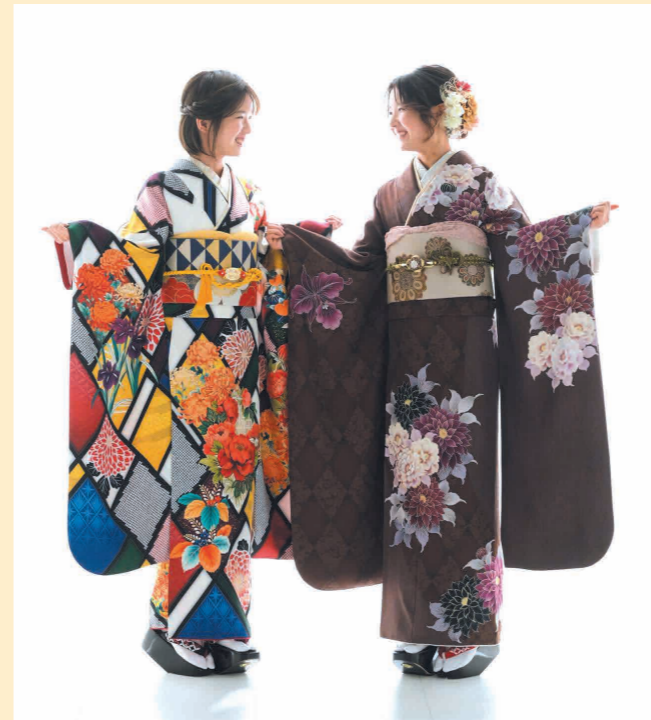
自分好みの振袖姿で双子姉妹の個性がキラキラ