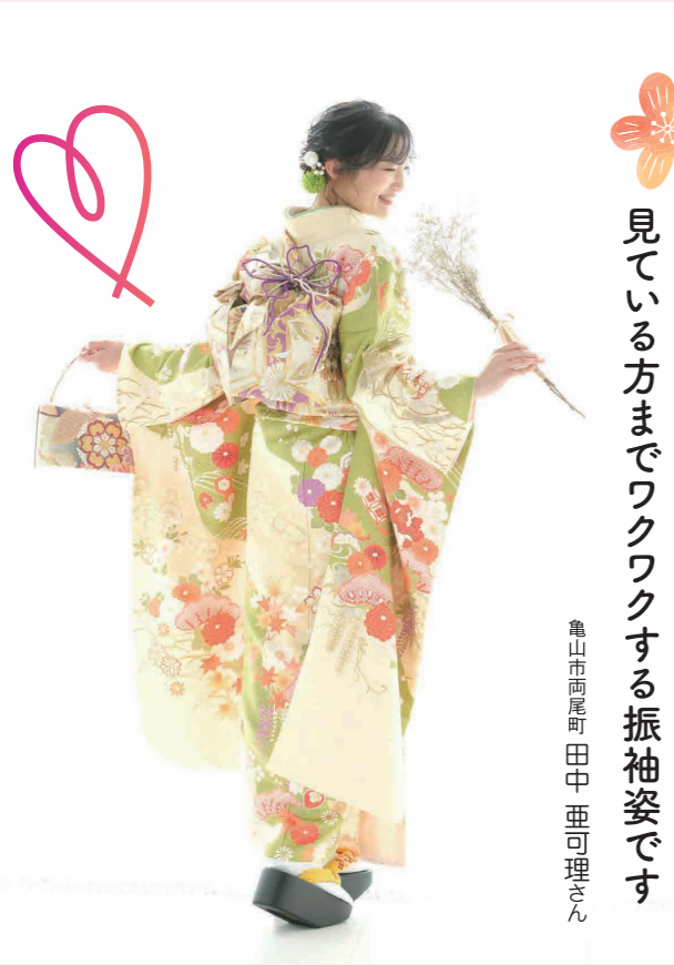
見ている方までワクワクする振袖姿です