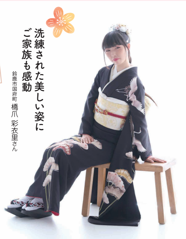
洗練された美しい姿にご家族も感動