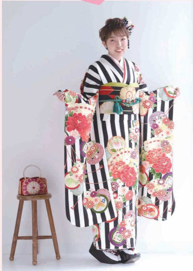
母娘三代のお気に入りです

お嬢様へのメッセージ 成人おめでとう。感謝の気持ちを忘れずに責任ある行動がとれるよう成長して行ってね。