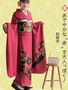
♡ あでやかな「赤」を大人っぽく！ 鈴鹿市