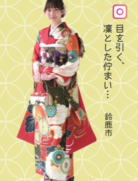
♡ 目を引く 凛とした佇まい！ 鈴鹿市