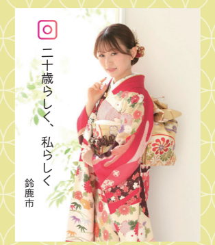
♡ 二十歳らしく、私らしく 鈴鹿市