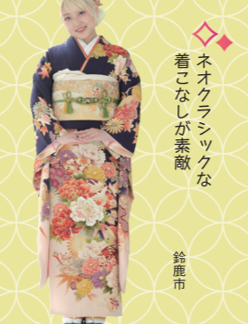
♡ ネオクラシックな 着こなしが素敵 鈴鹿市