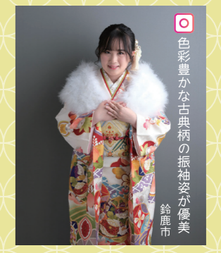
♡ 色彩豊かな古典柄の振袖姿が優美 鈴鹿市