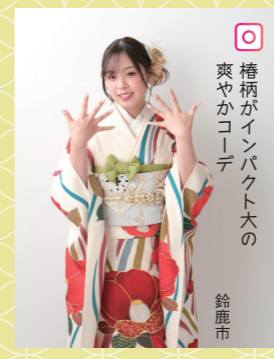
♡ 袴柄がインパクト大の 爽やかコーデ 鈴鹿市