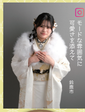
♡ モードな帯袖紋に 可愛さを添えて 鈴鹿市