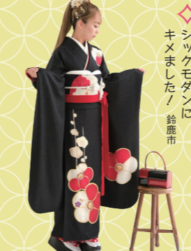
♡ シックモダンに キメました！ 鈴鹿市