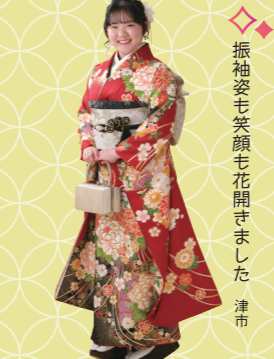
♡ 振袖姿も笑顔も花開きました 津市