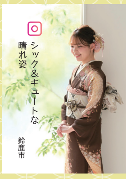
♡ シック&キューティな 晴れ姿 鈴鹿市