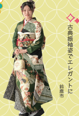
♡ 古典振袖姿でエレガントに 鈴鹿市

優美な振袖姿で笑顔が素敵な清佳さん。「家族が揃う機会は貴重なので、みんなで撮れて良かったです。祖母はアルバムの上仕がりを今も今かと楽しみにしています」とお母様です。