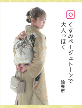
♡ くすみベージュトーンで 大人っぽく 鈴鹿市