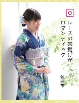
♡ レ이스の帯揚げが ロマンティック 鈴鹿市