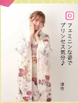
♡ フェミニンな姿で プリンセス気分♪ 津市