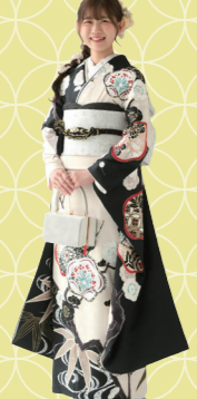
♡ モダンなコーディネートが お似合い！ 鈴鹿市