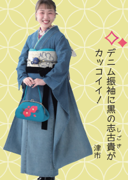
♡ デニム振袖に黒の志古貴が カッコイイ！ 津市