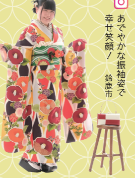
♡ あでやかな振袖姿で 幸せ笑顔！ 鈴鹿市