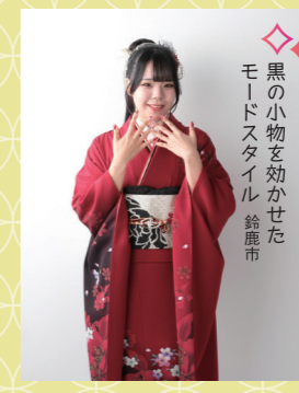
♡ 黒の小物を効かせた モードスタイル 鈴鹿市