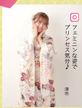
♡ フェミニンな姿で プリンセス気分♪ 津市