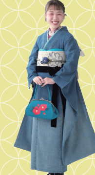
♡ デニム振袖に黒の志古貴が カッコイイ! 津市