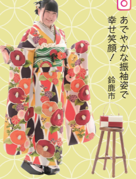
♡ あでやかな振袖姿で 幸せ笑顔! 鈴鹿市