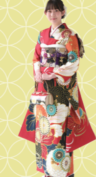
♡ 目を引く、 濃とした付まい! 鈴鹿市