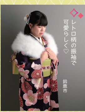
♡ レトロ柄の振袖で 可愛らしく♡ 鈴鹿市