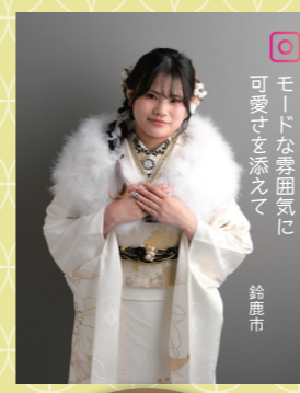
♡ モードな帯袖紋に 可愛さを添えて 鈴鹿市