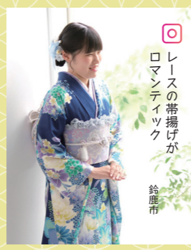
♡ レースの帯揚げが ロマンティック 鈴鹿市