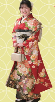
♡ 振袖姿も笑顔も花開きました 津市