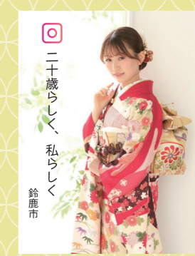
♡ 二十歳らしく、私らしく 鈴鹿市