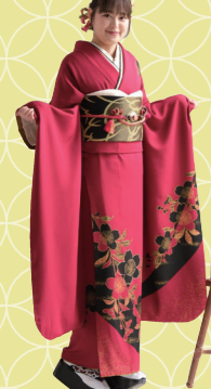
♡ あでやかな「赤」を大人っぽく! 鈴鹿市