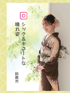
♡ シック&キューティな 晴れ姿 鈴鹿市