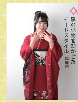
♡ 黒の小物を効かせた モードスタイル 鈴鹿市