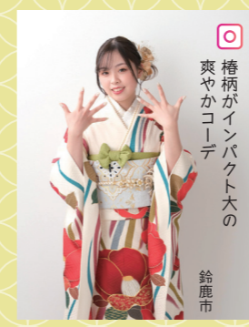
♡ 袴柄がインパクト大の 爽やかコーデ 鈴鹿市