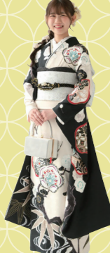
♡ モダンなコーディネートが お似合い! 鈴鹿市