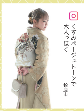
♡ くすみベージュトーンで 大人っぽく 鈴鹿市