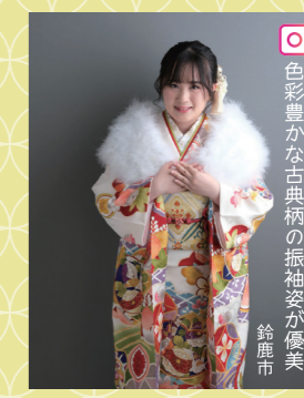
♡ 色彩豊かな古典柄の振袖姿が優美 鈴鹿市