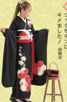
♡ シックモダンに キメました! 鈴鹿市